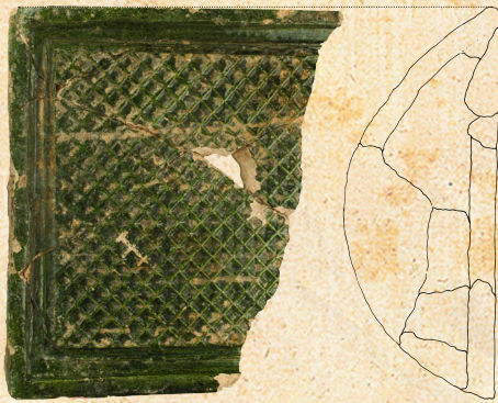
Komorová kachlica. Rozmery: šírka a výška čelnej steny 20,4 x 20,4 cm, priemer vykurovacieho otvoru cca 11,5 cm.

Nádobkové kachlice zostali z hľadiska formy nemenné, ale predsa mohol hrnčiar ich pôvodné okrúhle ústie vytvárať do podoby štvorca alebo obdĺžnika. S kvadratickými formami kachlíc nastúpili netušené možnosti celkového architektonického stvárnenia pecí s rovnými a zvislými stenami. Zároveň to bol len krok k tomu, aby bola čelná stena kachlice prekrytá hlinou a poskytla tak priestor pre umeleckú realizáciu. Vznikli komorové kachlice so zdobenou čelnou vyhrievacou stenou esteticky dotvárajúce čoraz pôsobivejší celok. Prostredníctvom celkovej zdobnosti pece prezentoval objednávateľ svoj spoločenský status a motívmi jednotlivých kachlíc zasa zbožnosť, vieru a svetonázor. V kachľových peciach sa tak spájala funkcia a estetika, ktoré išli pospolu so stále sa zvyšujúcou kultúrou bývania stredoveku.