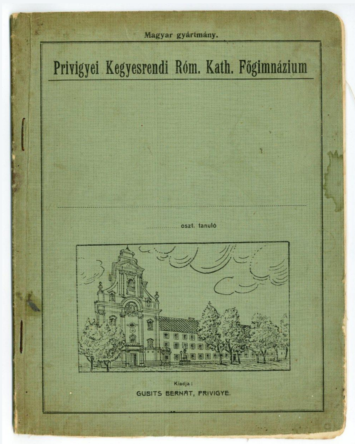
Predná strana obálky zošita s vyobrazením budovy školy a nápismi v maďarčine.