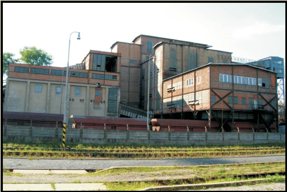
Súčasný pohľad na banský triedič v objekte železničnej stanice Handlová