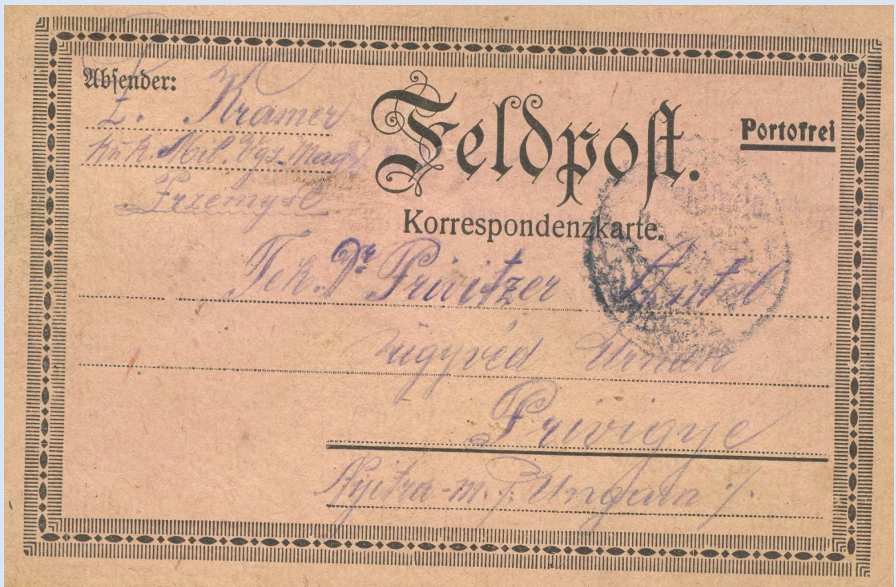
Korešpondenčný lístok poľnej pošty do Prievidze z 22. decembra 1916.

Otázka: Akým názvom sa označovala poľná pošta?