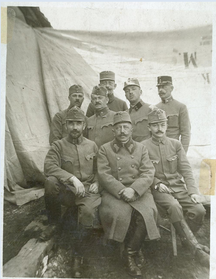
foto - kildák, egy alkalommal felvétel zsinle alypa rangs utti vortora's boó. Kipolyi am, - presu kó pen - k. n. r. ad. ei a tóru tizlikarát ábraroty Vélu m. ind. s. r. : 1917 2/28. Bolokop p. ún. s. d. d. (A) Triják ar. r. m. d. l.

bojujúcich strán, ktoré sa stali dominujúcim motívom pohľadníc. Do popredia sa dostali fotopohľadnice s ústredným motívom fotografií veliteľov alebo vojakov bojujúcich v zákopoch. Klasické pohľadnice vydávané po roku 1876, hlavne však po roku 1880 do začiatku 1. svetovej vojny, boli charakteristické tzv. dlhou adresou. Prichádza veľká zmena v tlači pohľadníc. Pohľadnica nadobudla dnešnú podobu dvoch strán, ktoré nazývame pohľadnice s krátkou adresou. Pohľadnice s dlhou adresou charakterizovala spoločná obrazová a textová strana a na opačnej bola adresa prijímateľa. Na nových pohľadniciach tlačených po roku 1914 sa adresná strana rozdelila zvislou čiarou na dve polovice. Pravá polovica určená na