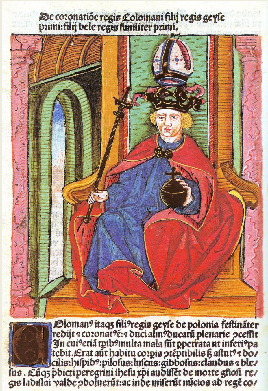
Uhorský kráľ Koloman zvaný Učený (* okolo 1070 – † 3. február 1116) z rodu Arpádovcov.

Prievidza bola kontinuálne osídlená už od praveku. Od prvotného usadenia sa človeka na území dnešného mesta však museli prejsť stáročia, kým prvý písomný záznam oficiálne zachytil existenciu Prievidze. Stalo sa tak v roku 1113, keď Preuigan – Prievidza vstúpila do histórie v metačnej listine benediktínov z kláštora sv. Hypolita na Zobore v Nitre v súvislosti s ohraňovaním ich majetku.