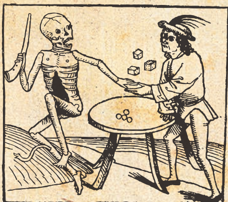
Tanec smrti. Heidelberg okolo 1485, drevoryt.

Hracia kocka kostená s vyrytými jankami 1 – 6, na každej strane iný počet. Farba tmavohnedá až čierna (prepálená?), rozmery 5,5 x 5,27 x 5,32 mm. Datovanie: 14. - 15. storočie.