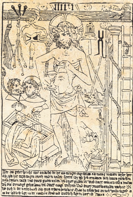
Zobrazenie Krista. Po jeho pravej strane vidieť ruku s mincami, tri kocky a plášť. Okolo roku 1470, pravdepodobne z Ulmu, drevoryt.

Kocka patrila v stredoveku bezpochyby k najrozšírenejším hracím pomôckam, avšak stredovek populárnu hru v kocky len zdedil po starších obdobiach. Už z Tacitových antických správ sa dozvedáme, že Germáni boli veľmi náruživí hráči: „ hrou v kocky sa zaoberajú tak vážne a náruživito, že keď prídu o všetko, posledným a rozhodujúcim hodom hrajú o svoju slobodu, ba dokonca o svoj život (Germánia, 58n).”