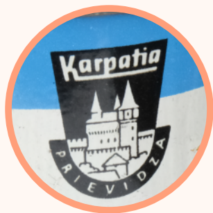
logo prievidského závodu Karpatia