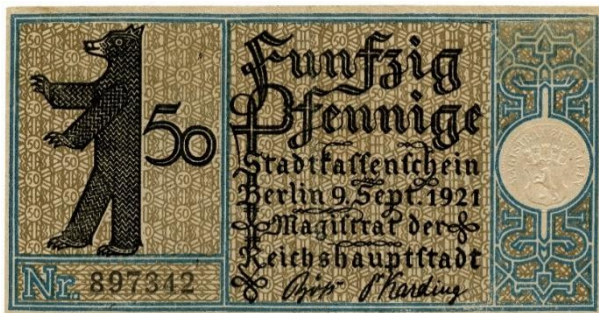
Magistrát hlavného mesta ríše, mestská pokladničná poukážka na 50 fenigov z 9. septembra 1921

Poľovnícky zámok znázornený na papierovom platidle je najstarším zachovaným palácom šľachtického a panovníckeho rodu Hohenzollernovcov v Berlíne. Základný kameň opevneného sídla položili 7. marca 1542, podľa všetkého na základe plánov staviteľa Caspera Theissa. Zadávateľom stavby bol brandenburský kurfirst Joachim II. Hector (1505 – 1571).