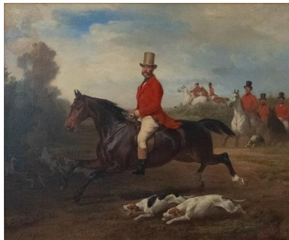
Pruský princ Carl ako Červený lovec na koni, okolo roku 1858

kurfirst, bol objekt opäť „obývateľný“, na dôležitosti mu to však nepridalo – v roku 1683 začali stavebné práce na novom poľovníckom zámku v neďalekom Postupime. Opätovné správy o poškodení strechy a schátraných rybárskych domčekoch viedli k nariadeniu o modernizácii Grunewaldu (v tom istom období sa v dokumentoch objavuje termín „zámok“). V roku 1740 sa dostal k moci Fridrich II. Veľký a poľovnícky zámok stratil definitívne svoj význam – slúžil len na príležitostné pobyty. Záujem o „grunewaldský“