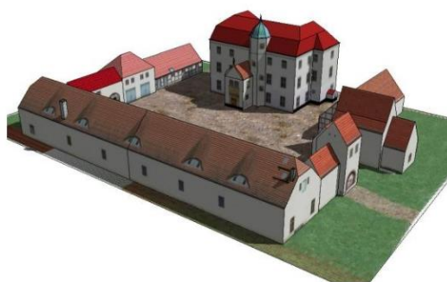
Poľovnícky zámoček Grunewald stojí na juhovýchodnom brehu jazera Grunewald a patrí do časti Berlin-Dahlem v obvode Steglitz-Zehlendorf. Samotné jazero je v časti Grunewald v obvode Charlottenburg-Wilmersdorf

plnili aj administratívnu a obytnú funkciu. Keďže však nešlo o plnohodnotné fortifikácie na strategických miestach, postupne strácali na dôležitosti. Okrem toho panovníci upevnili svoje územné nároky (príklad brandenburského kurfirsta) a ich najväčším vnútorným protivníkom sa stala zemská šľachta. S cieľom vyhnúť sa ozbrojeným konfliktom a objasniť nároky právnou cestou prijal cisár Maximilián I. na sneme vo Wormse 7. augusta 1495 reformný zákon o zachovaní večného mieru v krajine, no nie všetci šľachtici naň brali ohľad. V dôsledku tohto vývoja došlo na prelome 15. a 16. storočia k prestavbe hradov na zámky. Jednotlivé budovy sa začali deliť podľa účelu. Šľachtické sídla sa postupne menili na reprezentačné paláce, na vidieku rástli zámky navrhnuté špeciálne pre sezónne či poľovné pobyty. Aj poľovnícky zámoček Grunewald bol dlhé desaťročia zanedbávaný, preto ho brandenburskí kurfirsti (ríšske kniežatá s právom voliť cisára Svätej rímskej ríše nemeckého národa) takmer vôbec nevyužívali. Po opravách za Fridricha Wilhelma, prezývaného Veľký