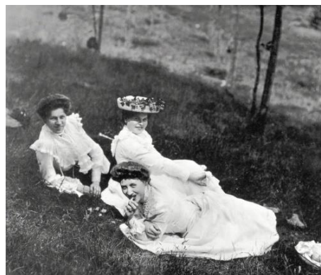
Tri berlínske dámy v Grunewalde, okolo roku 1905

cnostná, no na dvore sa vždy konali hostiny a orgie. Napríklad počas poľovačiek na zámočku Grunewald sa uskutočnilo takéto stretnutie v januári 1891. Známych je 15 účastníkov, medzi ktorými bol Fridrich Karol Hesenský či sestra cisára Šarlota Pruská