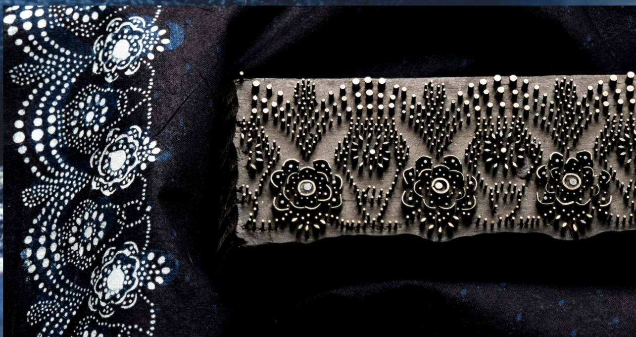
Detail identického florálneho vzoru na modrotlačiarскеj forme z dielne farbiara Jána Mišíka (Prievidza, koniec 19. storočia) a na okrajovej bordúre šatky (Lazany, 19. storočie) (Hornonitrianske múzeum v Prievidzi, Zbierky, História, Etnografia, H-4881, E-3966)