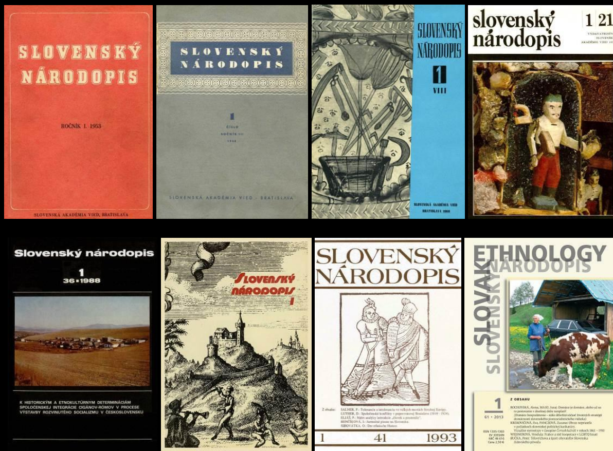
Vývoj grafickej podoby obálky Slovenský národopis

Zameranie časopisu Slovenský národopis určuje samotný názov vednej disciplíny zaoberajúcej sa etnografickým a folkloristickým výskumom slovenského národa, obsah od začiatku vydávania vymedzovalo územie Slovenska a región strednej Európy a okrem slovenských (a českých) príspevkov začali postupne pribúdať príspevky zahraničných vedeckých pracovníkov v pôvodných jazykových mutáciách. Po roku 1990 vnikala do všetkých spoločenských sfér pozvoľna angličtina, v časopise postupne nahrádzala dovtedajšie nemecké, ruské a francúzske resumé, ktoré zamenila za abstrakty a kľúčové slová, v roku 2010 pribudlo anglojazyčné piate číslo a počnúc 62. ročníkom vychádzajú prvé a tretie číslo v slovenčine, druhé a štvrté číslo v angličtine. Od roku 2011 má Slovenský národopis súbežný anglický názov = Slovak Ethnology. Jazyk však nie je jedinou inováciou, čoraz častejšie sa na stránkach časopisu objavujú práce z kultúrnej antropológie i ďalších príbuzných disciplín a interdisciplinárnosť sa prediera do popredia aj v pribúdajúcich monotematických číslach.